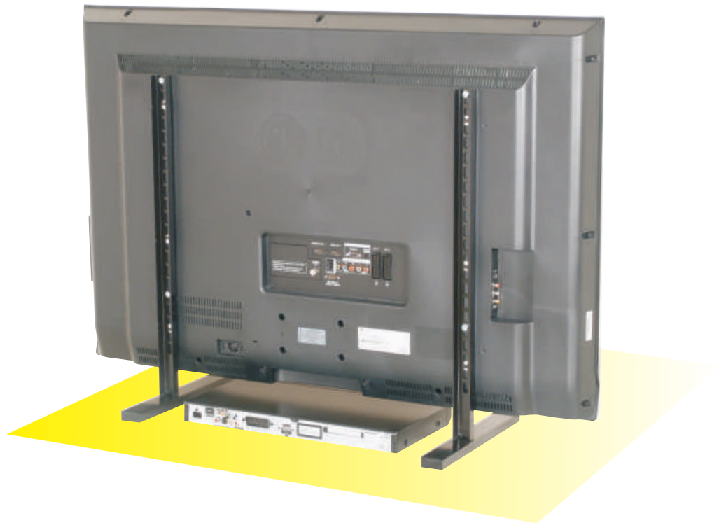
Esempio di installazione